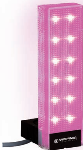
Osvětlení sloupku jednou z barev – zdůraznění výstrahy (externí ovládání)