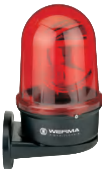
Držák na stěnu (příslušenství)