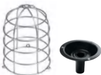
Drátěný koš a příruba pro montáž na trubku (příslušenství)