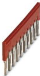
Zástrčný můstek, rozteč: 8,2 mm, šířka: 80,3 mm, počet pólů: 10, barva: červená

Upozorňujeme, že zde uvedené údaje pocházejí z online katalogu. Úplné informace a údaje naleznete v uživatelské dokumentaci. Platí všeobecné podmínky použití pro stahování z internetu. ( http://phoenixcontact.de/download )