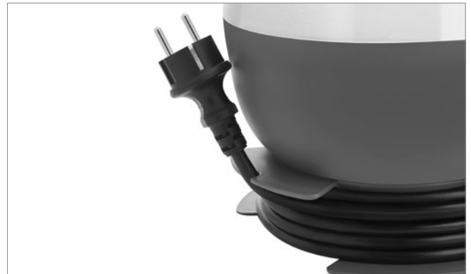
Ergonomiczny zacpek przewodu Ergonomic cable management