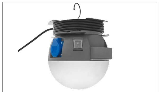
Hak do podwieszania lampy Hook