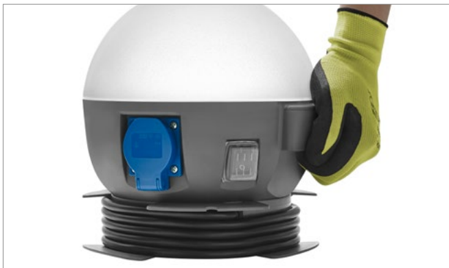
Rączka ułatwiająca przenoszenie, wyłącznik / wyłącznik Ergonomic handle, switch on/off