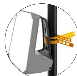
Opaska mocująca w komplecie Zip-strap in set