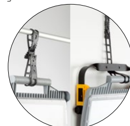
Opaska mocująca w komplecie Zip-strap in set