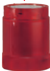
Pevně svítící díl