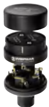
Základní díl s víčkem