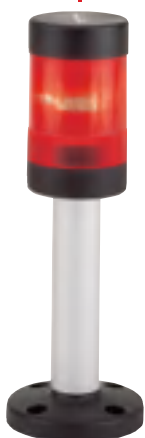
Základna s trubicou