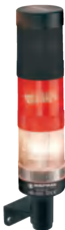
Montáž na stěnu