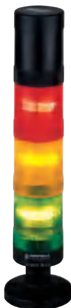
Montáž na základnu