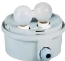
Semaforové světlo dvoupaticové