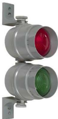
890 s upevňovacím držákem